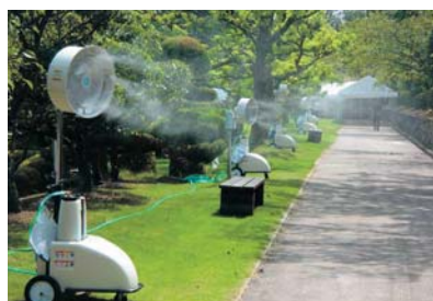
【スーパー フォグ ジェッター】