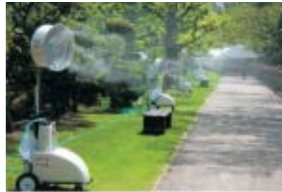
【スーパー フォグ ジェッター】