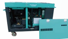
大きく開く点検扉でラクラクメンテナンス!