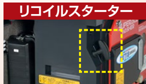
リコイルスターター