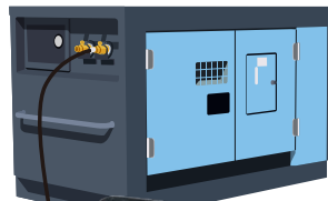
エアコンプレッサー